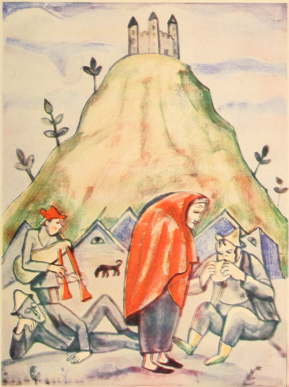
די מאמע מיט אירע דריי זין.